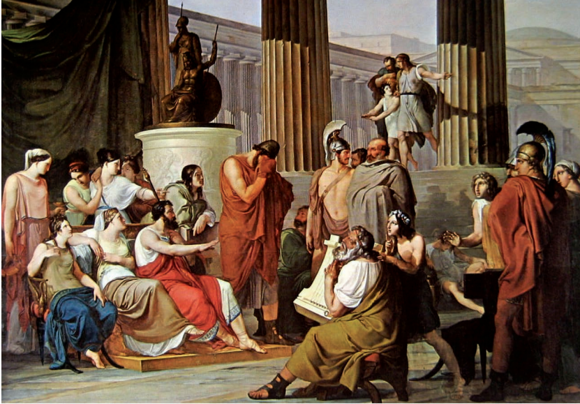
Fig. 3. Ulisse alla corte di Alcino re dei Feaci – Francesco Hayez.

Le storie hanno un ruolo fondamentale nella conoscenza umana e consentono di approdare alla consapevolezza di dimensioni della vita che non potevano essere comprese prima dell'ascolto della narrazione. Questo aspetto è raccontato molto bene da Omero nell' Odissea . Alla corte dei Feaci, un aedo cieco, canta le gesta degli eroi; racconta della guerra di Troia, narra di Ulisse e delle sue imprese durante un banchetto. L'eroe, presente alla corte in incognito, sentendo questo racconto, la narrazione della sua storia, fatta da un altro, con altre parole, ne resta turbato e nascondendo il volto dietro il mantello purpureo, comincia a piangere. Attraverso il racconto Ulisse acquisisce la consapevolezza di sé, il significato della sua storia e riscopre la sua identità. Di fronte al pianto dell'eroe, il re dei Feaci chiede all'ospite di rivelarsi. L'eroe si disvela e può dire: "sono Ulisse figlio di Laerte re di Itaca". Ulisse verrà poi riportato dai Feaci a Itaca: simbolo della ritrovata consapevolezza, della propria strada.