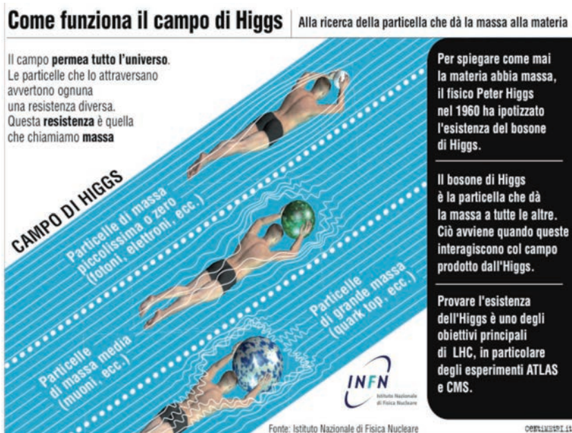
Fig. 1 – Illustrazione del funzionamento del meccanismo di Higgs.

Come accade questo? L'universo, secondo Higgs, è permeato ovunque dal campo di Higgs. Le particelle, muovendosi in questa sorta di "fluido", sono come "frenate", si muovono a velocità inferiore alla velocità della luce e dunque, ancora per la teoria della Relatività Ristretta, acquistano massa. Per alcune di queste particelle, come i fotoni, il fluido è completamente trasparente: queste non avvertono alcun effetto, continuano a muoversi alla velocità della luce e dunque non acquistano massa. Il meccanismo appena delineato è illustrato in Fig. 1 .